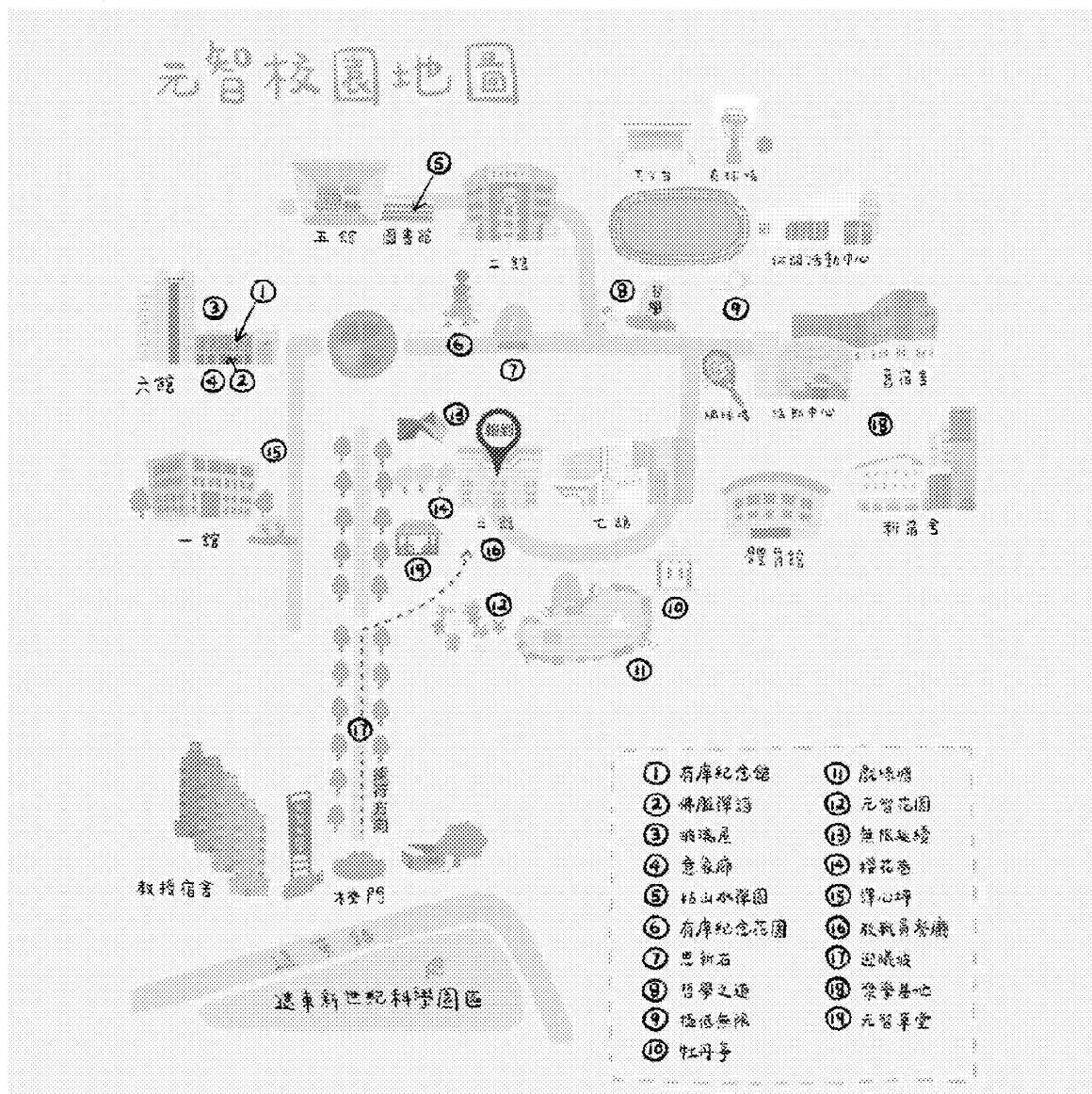
元智大學校區平面圖